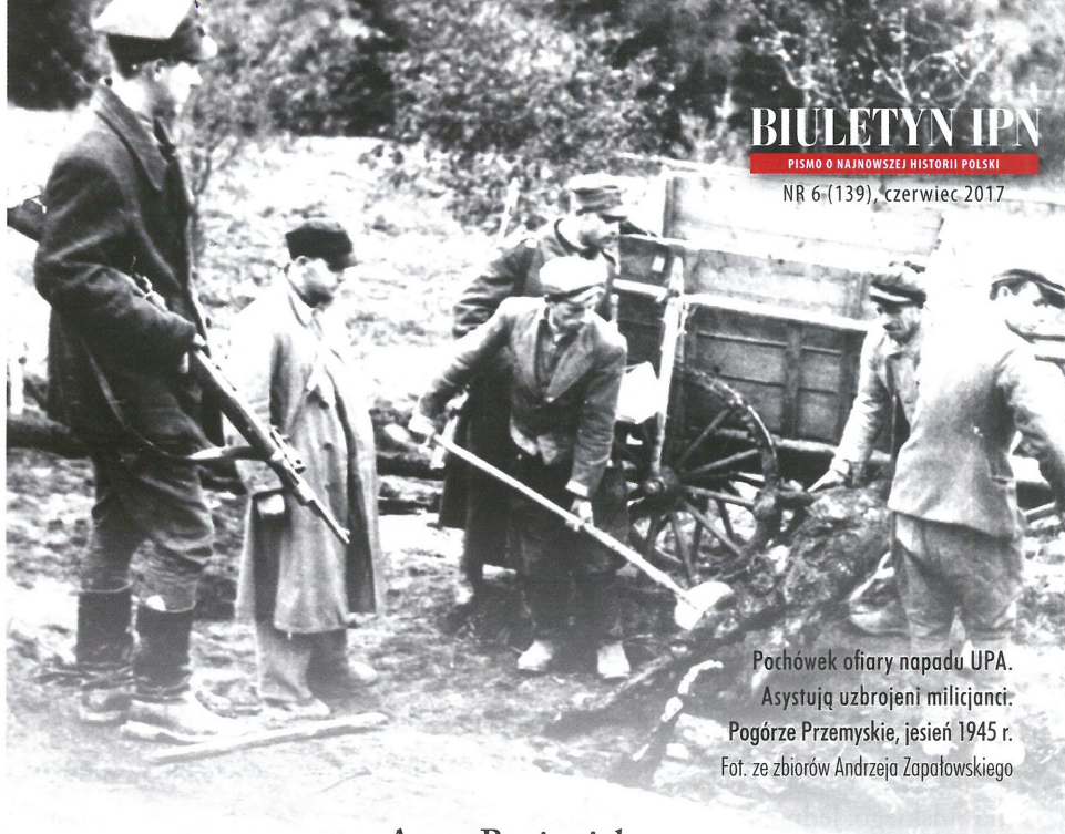
Pochówek ofiary napadu UPA. Asystują uzbrojeni milicjanci. Pogórze Przemyskie, jesień 1945 r.