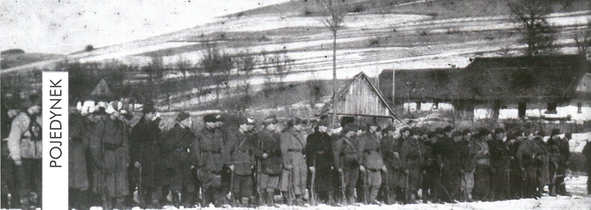
Sotnia „U 4” Włodzimierza Szczygielskiego „Burlaki” we wsi Jamna, 1946 r.