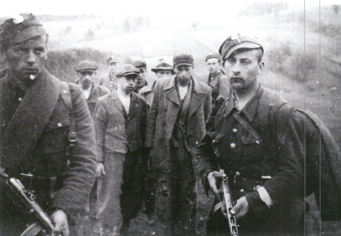
Upowcy złapani przez żołnierzy WP pod Sanokiem, maj 1947.

Członkowie OUN i UPA byli zdemoralizowani i gotowi popełnić najstraszliwsze zbrodnie z przyczyn etnicznych, nawet na członkach własnej rodziny.