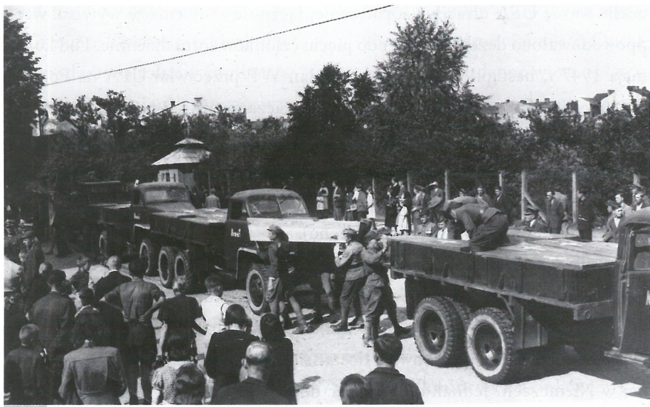
Przenoszenie trumien ze zwłokami żołnierzy WP, którzy zginęli podczas potyczki z trzema sotniami UPA; cmentarz na Zasaniu w Przemyślu.

działał Sąd Wojskowy, który w trybie doraźnym skazywał ujętych z bronią członków banderowskiego podziemia. Zapadły 173 wyroki śmierci, z czego wykonano 120.